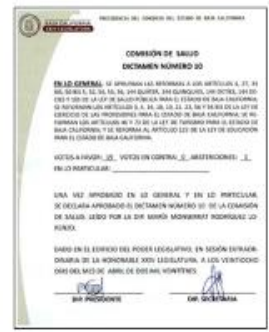
Dictamen 10 18-21/10/2022