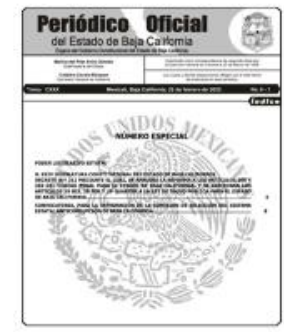
Decreto 212 22/02/2023