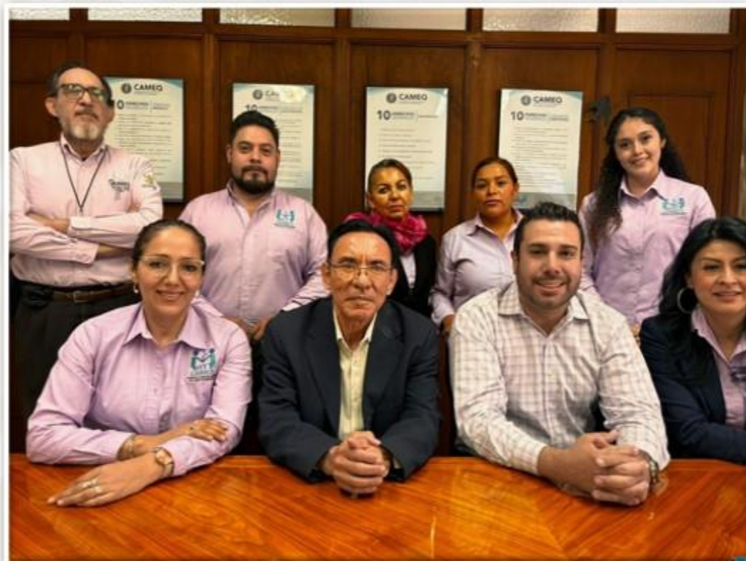
Comisión de Arbitraje Médico del Estado de Querétaro (CAMEQ)